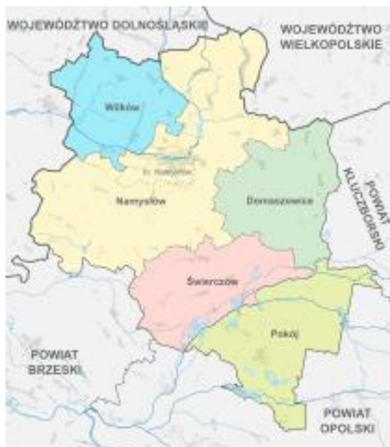
Rys. 1. Schemat powiatu namysłowskiego